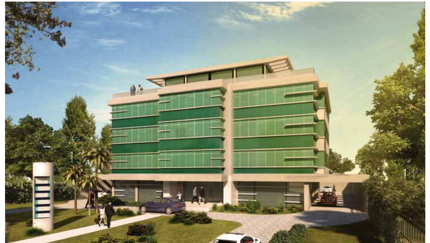
AMERICA PARK // Ubicación: Avda. de las Américas, Canelones, Uruguay / Año: 2011 Superficie: 1600m 2 / Programa: Proyecto Edificio para Oficinas / Proyecto: Estudio Bazzurro.

La Arquitectura es la envolvente espacial que rodea al hombre. En la medida en que nos prestemos más atención a nosotros mismos, escuchándonos y comprendiéndonos, podremos ser mejores, más eficaces al momento de escoger nuestro espacio. Y vivir en él.