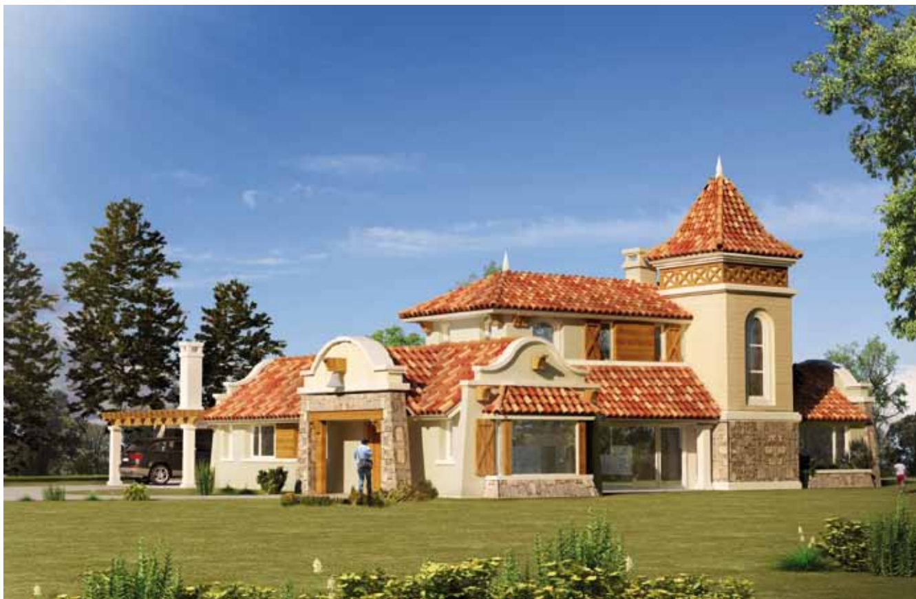
CASA EN LOMAS DEL POLO // Ubicación: Urbanización Carrasco Polo, Montevideo, Uruguay / Año: 2011 Superficie: 300m 2 / Programa: Residencial / Proyecto: Estudio Bazzurro.

La versatilidad del Estudio Bazzurro hace posible el despliegue de proyectos que recorran distintas líneas estéticas, siguiendo siempre la inquietud y el perfil cultural del habitante para el que trabaja. En este caso regresa a una línea en la cual el Estudio ha aportado mucho a lo largo de los últimos veinte años, recreando un espíritu de Provence, con cubiertas a dos aguas revestidas con tejas y con una torre circular que se levanta imponente para ordenar el juego de volúmenes que propone el edificio.