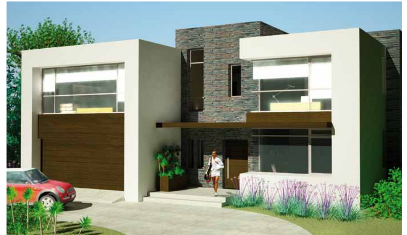
CASA EN LA TAHONA // Ubicación: Urbanización la Tahona, Canelones, Uruguay / Año: 2011 Superficie: 410m 2 / Programa: Residencial / Proyecto: Estudio Bazzurro.

El proyecto encargado al Estudio Bazzurro presentaba las limitaciones de un terreno entre linderos ya construidos y las ventajas expresivas de un entorno paisajístico cuidado, sobrio y sin parámetros estéticos dominantes. La propuesta del Estudio se apoya en el gesto contemporáneo que racionalmente se apoya